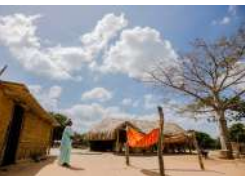
Imagen 1. Líneas de acción Estrategia de Puertas

Sin embargo, esto no es una novedad en TGI. Desde junio de 2019, se inició la ejecución del Programa de Voluntariado Corporativo con su primera intervención en el Departamento de la Guajira en dos instituciones Etnoeducativas y posteriormente muchas más intervenciones para el año 2020 y 2021. A continuación, se conocerán las acciones llevadas a cabo para este año.